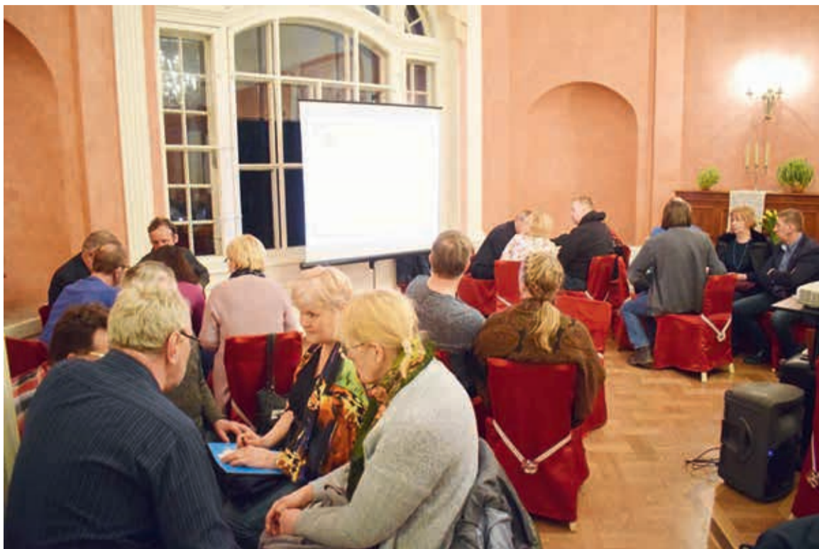
Mulgi mälumängu perämine jagu peeti Kärstne mõisa saalin. Latsin olli 14 võistkonda, pildi pääl kige ihen punt Abia, kes siikörd võidu kodu viis.

Egä kõrd küsiti 22 küsimust. Pääle mulgi värgi ollive teema-