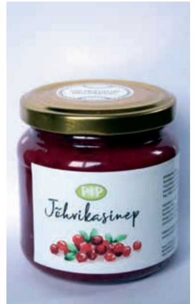
Kuremarjasinep om kundele mokka müüdä.

et toetusi egä laene ei ole pidänu küsime. Sedä enämb piap muduki rahaasjel silma pääl oidma, et saas kah midägi uut osta ja äri edesi viia. Lähemb ja suuremb sihk om oma kaupa rohkemb reklaami. Sedä saap äste tetä üle Eesti laate ja messe pääl käien. Säält tulep sis purke päält kaase maha käändä, keedussit inimestele pakku ja kullete, mes na arvave. Muduki om vaja müügikotussit kah manu otsi.