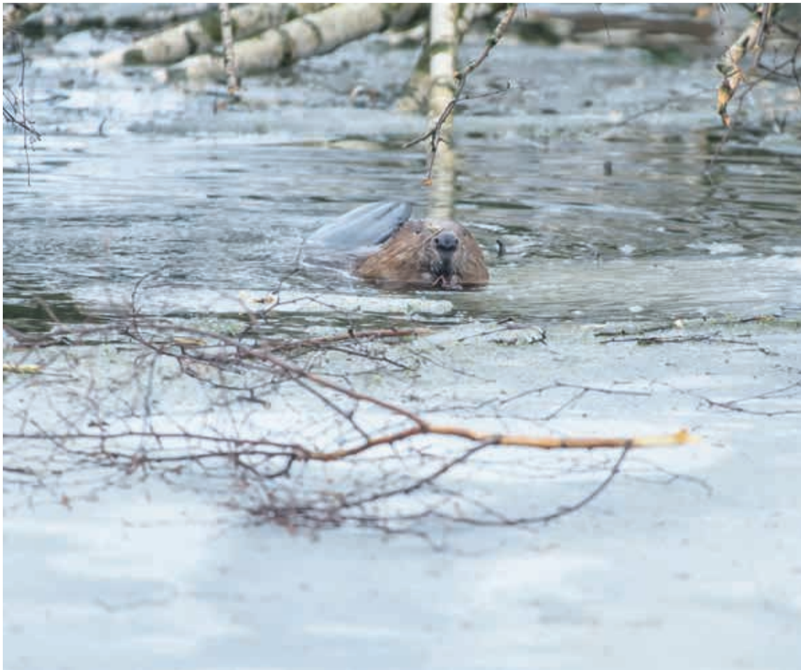
Sii kobras om pildi pääle jäänu Tarvastu kandin.

Eluasemess om kõrgemben kaldan uru, märjeben roikist ja ossest mättide ja mudage tihendet pesäkuhila, vahel esiki tuakõrgutse. Uru viivä pesäst vette. Kus vett vähä, sääl rajave kopra paise ja kaabive pövvage sügävembele uusi