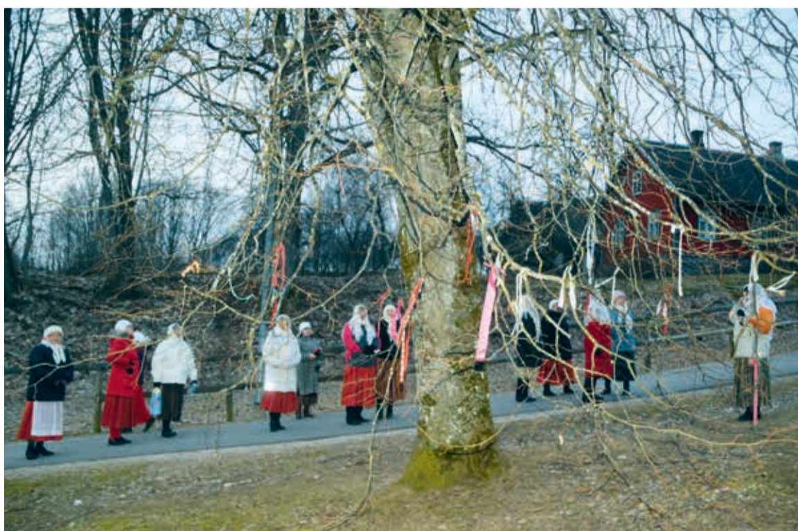
Maarjapäeväl seove Karksi naise punatse pagla puu külgi ja soovive endele ja omastele midägi ääd. Sii om nagu tillike ohvreand.

Sel päeväl om naistel tüütegemine ärä keelet. Ommuku tullas aigsaste üles, võetes linnupetet ja minnas ütenu töiste naistege päevä terviteme. Sellän piap