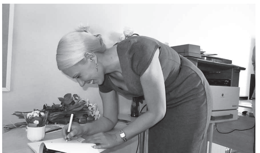
Õpiku kokkusäädai Meila Israel ei ole esi küll mulk, a om nüid mulgi keele õpide ääs suure tüü ärä tennu.

“Karksi murraku õpik” annap teoreetilise ülevaatusge Karksi murraku grammatikast ja vastap põhikooli eesti keele ainekavale.