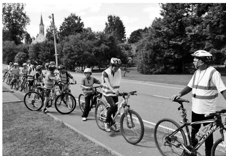
Noorde rattasõit akas pääle Paistust ja viis vällä Kärsnese.

Sama päevä sissi mahtusi viil Mulgimaa talueluge tuttaves saamine ja obesteges ratsa sõitmine. Meid võtsive lahkeste vastu Retsniku talu peremiis ja perenaine.