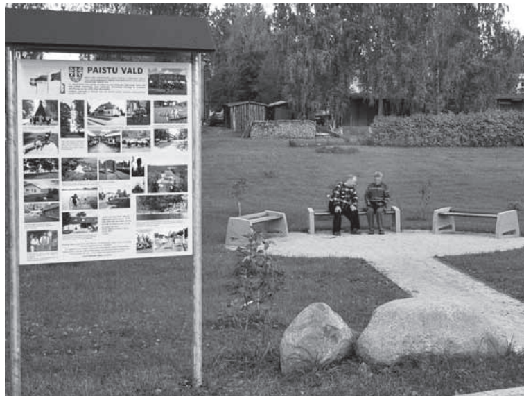
Kige tähtsambe sündmuse Paistu valla 22 aastesest aaluust om korjatu tääbetahvle pääle, mes mõne aaste peräst seisap sirelide sihen.

46 sirelit 13 eri sordist om saanu ütteme pargis, kos võip otsi sireliõnne, puhmaste vahel kokku saia, pargipengi pääl istu, vaadete vällä säetu päeväpilte ja ek mõtelde mõnikõrd kah sedämuudu, et elu