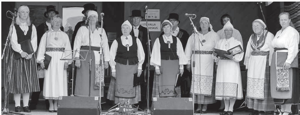
Paistu laulukuur.