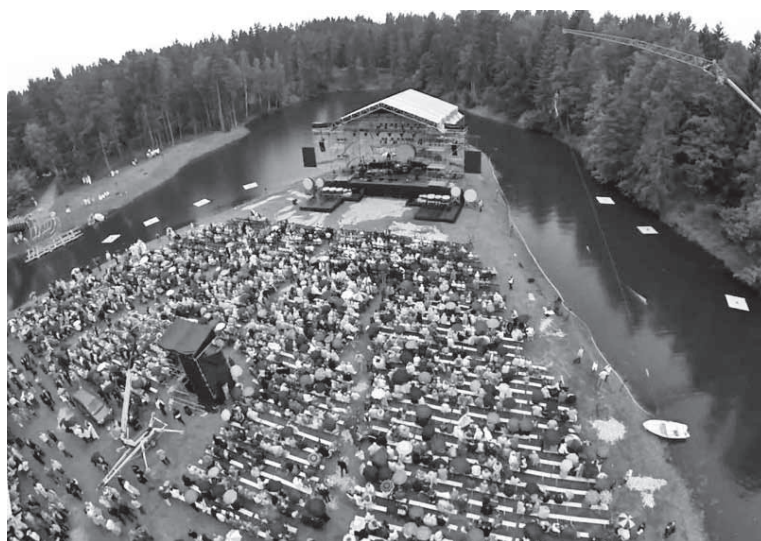
Tõrva Loits 2013 ülevest puult vaadeten. Pilt: internet

ütte. Olli ju peris õige tule ja vii pidu. Üteldes, et suvitse pidu tiip ilm, aga Tõrva Loits om esieralik: tetäs egä ilmaga ja rahvast tulep egä aaste järest rohkemb. Kui mudu ei vii tii Tõrva, sis üits kõrd aasten tullas siia kindlaste loitsule. Esieraligus tiip konsserdi sii, et edimene, tasatsemb jagu akkap õhtu ämären, aga tõine, kõvemb jagu ütten tule ja muu iluge om juba peris pimen. Iistvedäjidel om viil meelen viietõistku aaste tagune “Borgi