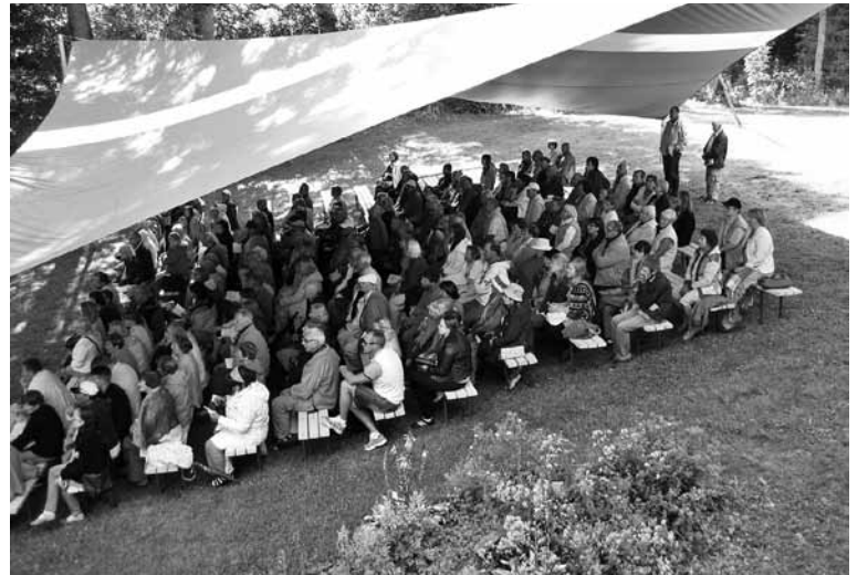
Nava lava purikatus om joba kahessa aastet rahvast vihma iist varjanu.