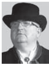
Agu Kabrits Tõrva linnapä

I lus suvi om läbi saanu. Luudus Land meile üitsjagu päevä, aga olli kah parasjagu vihma. Vihma saive tunda kah kik Tõrva loitsulise, nii päältvaateje kui kah ülesastjade. Olli kuvves Tõrva Loits – uhkemb ja suuremb ku kunagi enne. Pallu and manuu us pidukotus, just sii aaste peris valmis saanu ja puhtas tettu Veske paisjärv ütten oma puulsaarde ja saareksidege. Silmailu pakk sii Veske paisjärv muduki äripäeväl kah. Joba om tekkunu nuurpaarel tore komme sääl ütistöisele jah-sõna ütelde. Kindlaste and siande ilus kotus abielule pikkust ja kestvust manuu. Minnen tagasi loitsu manuu, sös saime tõeste edimest kõrda tunda vihmasadu ja peris tugevet. Rahvast sii es eidute, vastuossa liit rohkemb