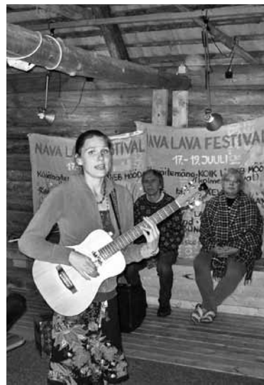
Anu Taul Nava talu küünin.