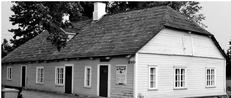
Kitzbergi muuseum Maiel om ilusambes saanu nii siist- ku vällästuult.

Sii aaste om jälle Kitzbergi Sõpre Seltsil pallu ettevõtmisi ollu. Nava Lava vestival juulikuul olli siikõrd, pühendet Kitzbergile, sääl kõnel suurmihe elust ja luumisetüüst kah Asta Jaaksoo. Seni olemen ollu Kitzbergi kirjanduseradadele om paar uut kah manu tullu: "Kitzbergi äpardunu reis Ruhja" ja "Muinaseestlaste pühä paiga".