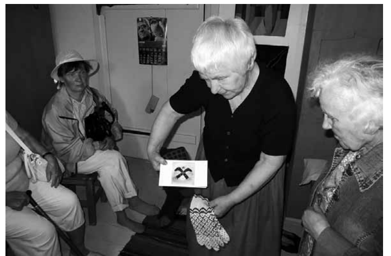
Anu Raul jakkus näputüü jaos äid mõttit nüidse aal kah.

Edimesse lassi lätsi ma 1950. aastel – vaesel rassel aal peräst sõda. Poistel ollive sellän tore jaki. Nii ollive kodun koet kangast ja piaaigu mitte kunagi ütte värvi. Manseti ja õlaku ollive ütte värvi, jakk esi jälle tõist värvi. Vestel ollive tihtilugu jälle selg üttest ja õlma tõisest röövast tettu. Miul omal olli armas leit. Leit esi olli röövakangast, käisse kudas emä varaste pääl. Latse ollive