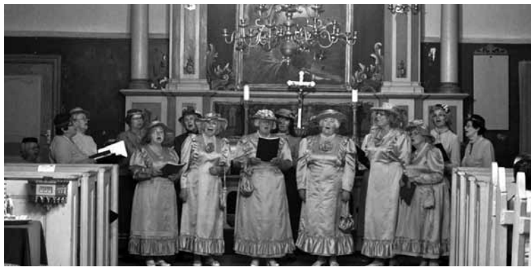
Ansamble Ehatäht ja Höbeniit Karksi kirikun miipidu valla laulman.