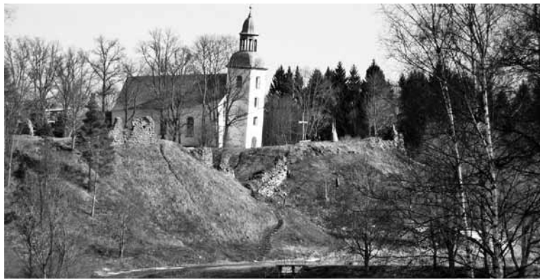
Karksi Kirik om esierälik selleperäst, et temä torn om üle kate miitre viltu vajunu.

Aga kirikuge ei ole siinmail kunagi pikalt muretut aiga ollu. Puukirikit om ehitet mitmit kõrdu, aga iki om sõda neid mineme pühknu, nõnda et täpsempe kostuski ei ole ämp tääda. Viimäne säänte ehiteti pääle Põhjasõa vaest ja viletsat aiga 1730. aastel Johann Ucke õpetejes oleku aal. Aga siigi pühäkoda tunnisteti väige viletses, enne ku selle tubli pastori päält viiekümneaastene teenistusai ümmer sai. 1773. aaste septembren otsusteti ehitte kivikirik otse lossivaremite pääle, kus juba vundament ja kaits kõlbulikku müüri endisest aast oleme ollive. 1775. aastel olevet kirik juba katusse all ollu ja 1778. aaste septembren vaats kirikukonvent uune üle ja võtt vastu. Sama kõrrage anti kah