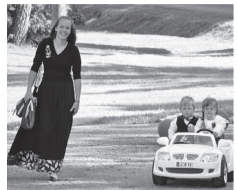
Üits paar olli kogundi autuge rongikäigun.