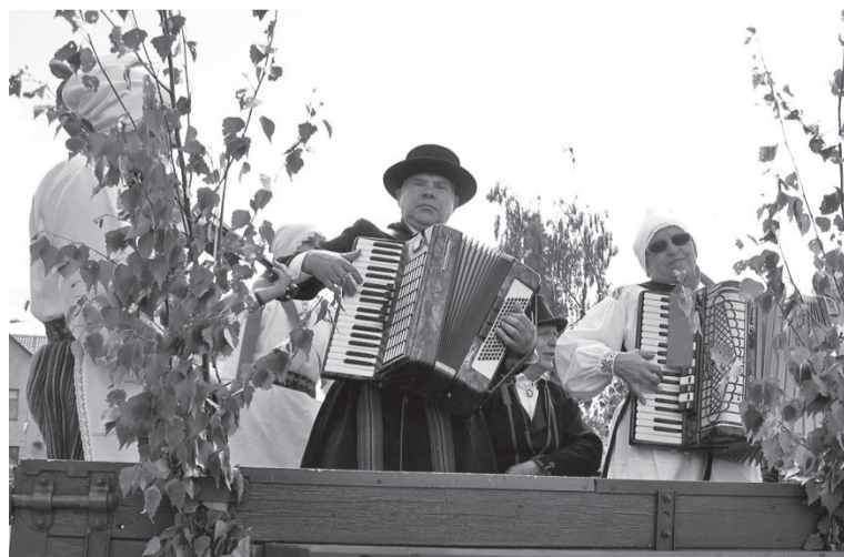
Laolupeotuli sõidap rahvamuusikaansambel Jauram pillilugude saateli müüdä Mulgimaad.

Ja sis jälle laolu ja pillilugude kõladen edesi, Tõrva. Selleperäst, et ring oli täis saanu. Kiken Mulgimaa omavalitsusten laolupeotuli süttinu. Tuli, mis kandse enesen sõnumit, et kik selle kandi elänigu om peole oodetu. Egäl puul, kus kutsuv tuluke leegitseme lei, lubasive inimese kohale tulla ja tetä kik enesest oleneve selles, et Mulgimaale ja kigele Eesti maale ning rahvale nii oluline sündmus kõrda lääs.