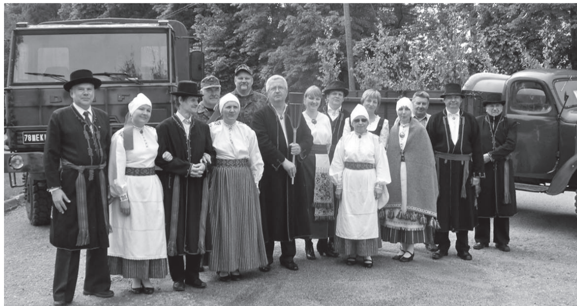
Laolupeotule viijäde om valmis tiile asume.

Abja keskvääläku pääle oli tullu laolupeotuld vastu võtma