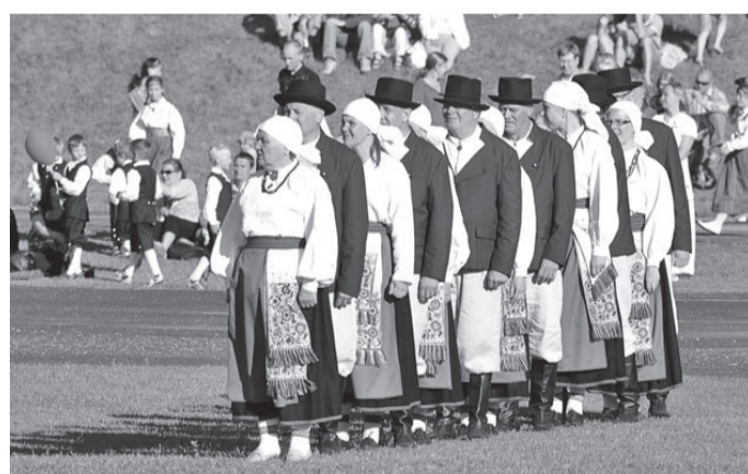
Möista, möista, mitu miist?