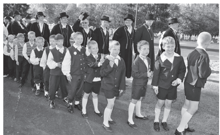
Üits tants olli säetu pallald meestele.