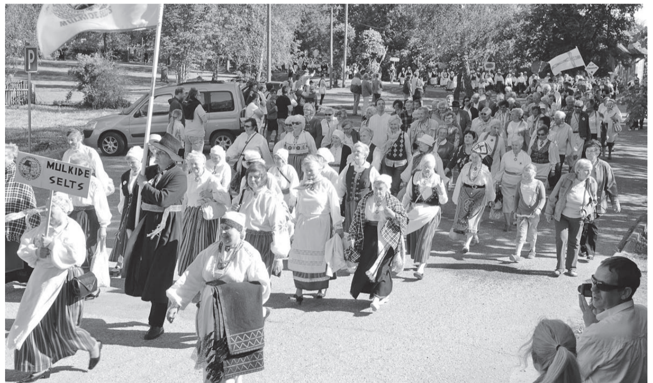
Kik Mulke Seltsi kogukonna ollive kah Tõrvan platsin.