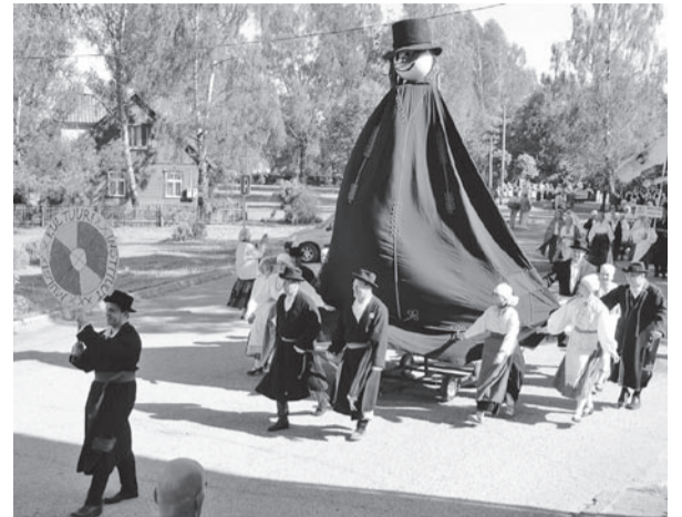
Ja akaski rongikäik pääle. Mulgi Kultuuri Instituut iiki kige ehen.