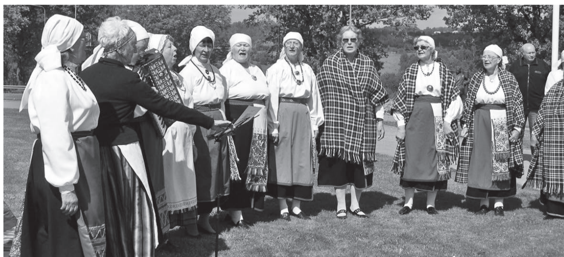
Rahvas tervit laolupeotuld iluside laule ja tantsege.