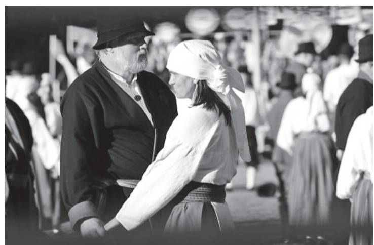
Ja olligi aig tantsuge pääle akate.