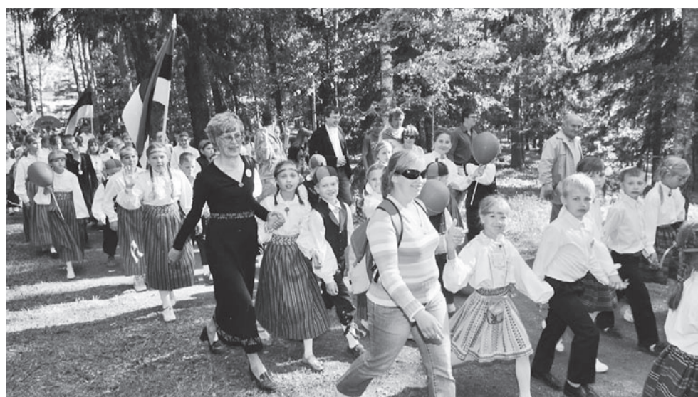
Ilus ilm ja uhke rongikäik vedäsive suu naarule.