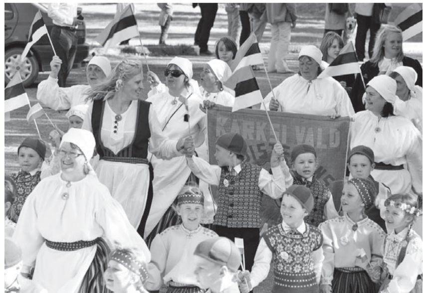
Akkamen ollive nii suure ku tillikse mulgi.