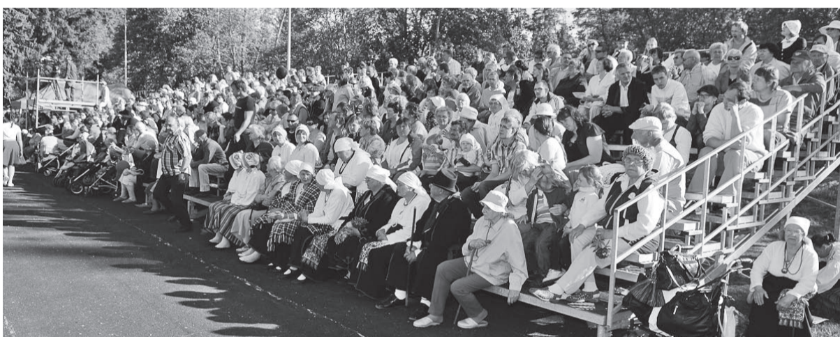
Staadjuni pääl uutsive joba päältvaateje.