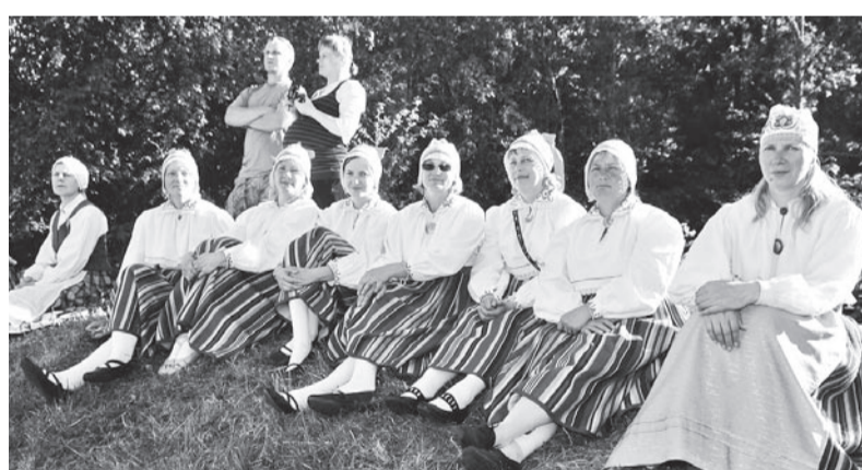
Küll olli ää, ku istma sai!