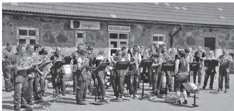
Pidu pääl ollive kolm pasunekuuri kah. Pildi pääle jäive ”Popsi”.