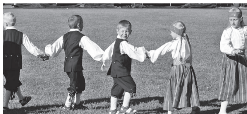
Esiki kige tillembe tantsjade ollive vällän.