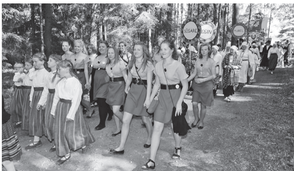
Tüdriku- tillembe ja suurembe.