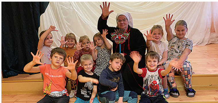
Ritsu lasteaia latse ütenu Laande Allige.

"Siikõrd olli meil peris ümärik tähtpäev – 25 aastet Mulgimaa laste vullklooripäevä ürgüsest. Tore, et sii lasteaidun käimine trehväs just märdikuu sissi. Mia olli sis märdi- või kadriemä, lauime ütenukuun märdi- või kad-