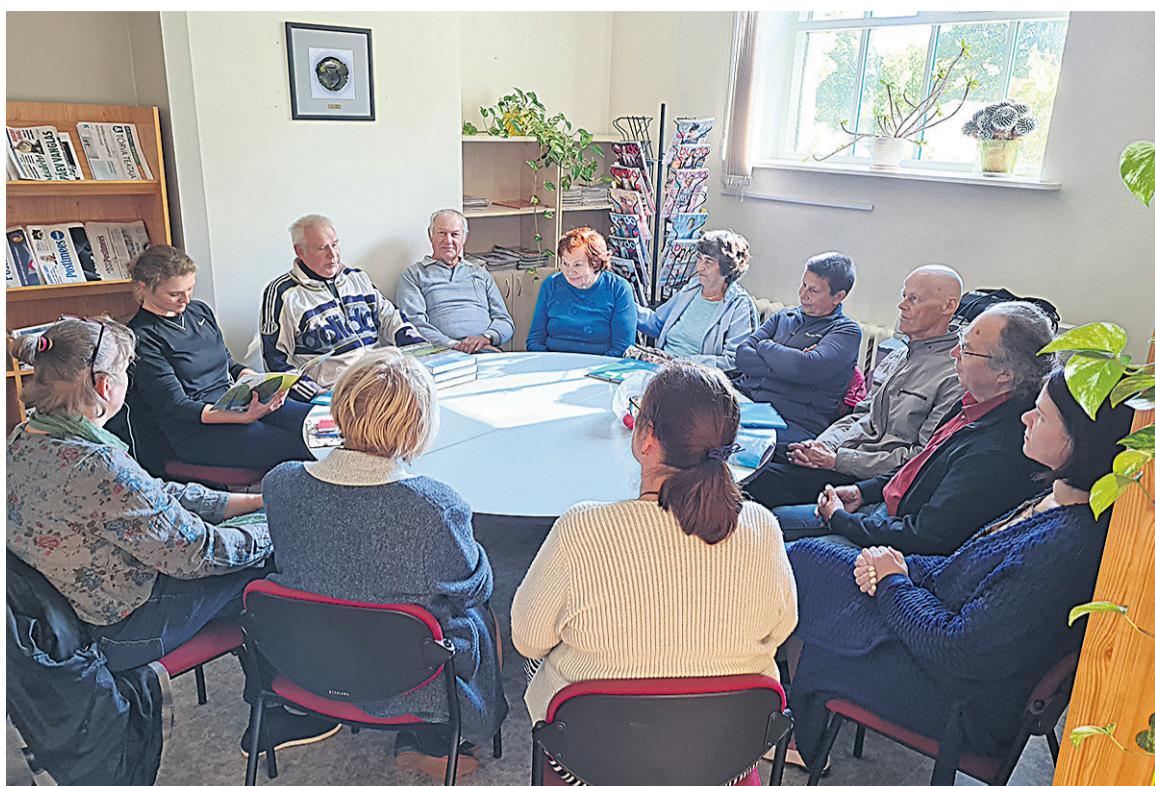
Tõrva mulgi keele ringin om egä kõrd latsin vähembelt tosin perimuskultuuri uvilist, kes ää meelege nuputeve, kudas uusi asju mulgi keelen kutsu.