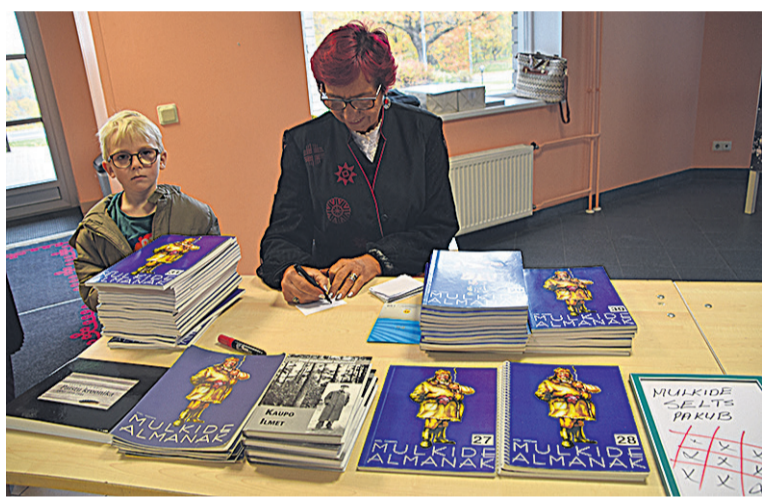
Mulke seltsi nõnamiis Saare Ene mulgi kirjavara laadal mulgi almanak- ke müümän.