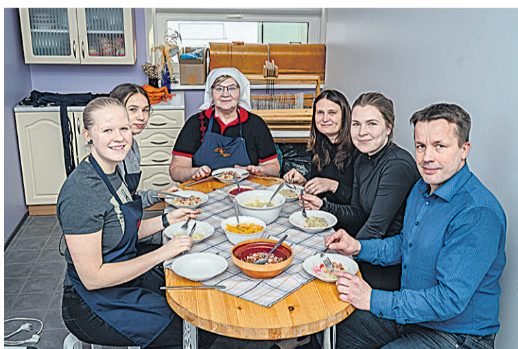
Pikä päevä lõpus saive pudru- ja vilmitegije ütten koolidirekturige kah süümä istu.

min, et võtta üles Mulgi pudru süümine ja tegemine koolin. Vilmi pääle sai üits söögivahetunn ja Laande Alli Mulgi pudru tüükammer koolilatsel.