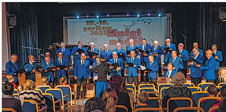
Sakala miiskuur Mulgi nädäilil tõisel mulgikiilside laule võistelusel üles astman.