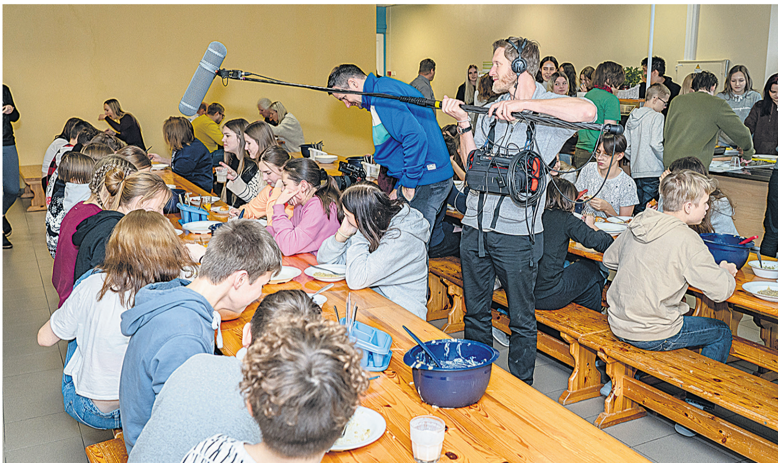
Ku Kitzbergi gümnaasiumi koolilatsse söögivahetunni aal Mulgi putru seive, käisive vilmi mehe laudu vahel, et kik siis pudrusüümine üles võtta.

20. jaanuaril olli osäühingu Menufilmid vilmirupp Karksi-Nuian Kitzbergi gümnaasiu-