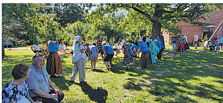
Mulgimaa peremängulise Sudiste külämaja man lustman.