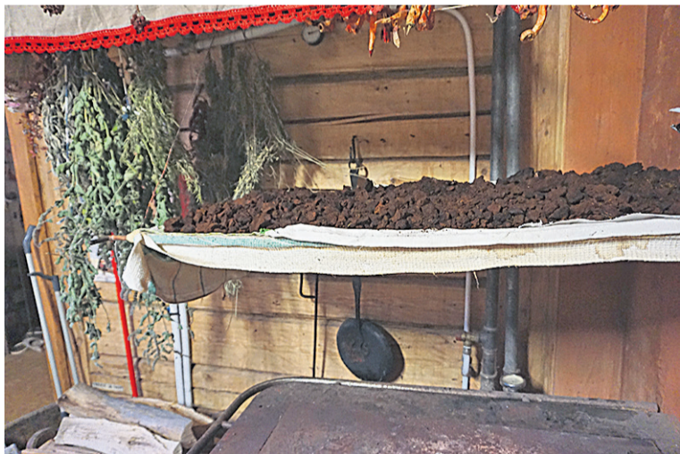
Ku pässik om kodu tuudu ja peenembes taotu, tulep tüki lämmese kujume panna.