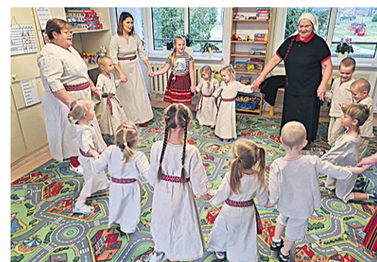
Perimuspäev Öisu lasteaian Laande Alli juhatusenge.