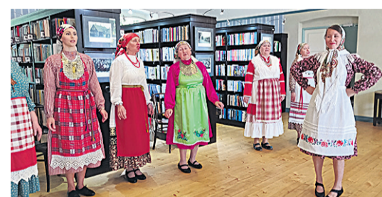
Udmurdi ansambel Ošmes Mulgimaa peremängul Kulla leerimajan.