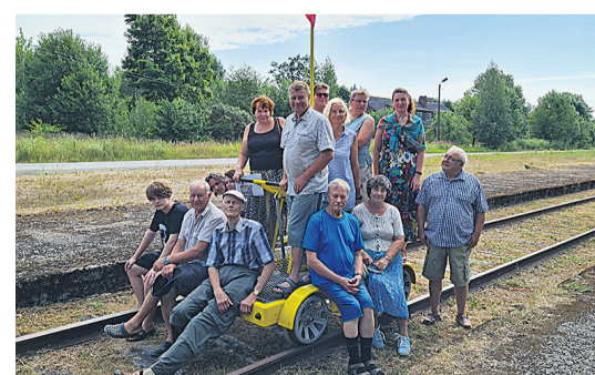
Tõrva murdering käis suvel Mulgi vallon uvireisil. Pilt om tettu Mõisakülän dresiini pääl.