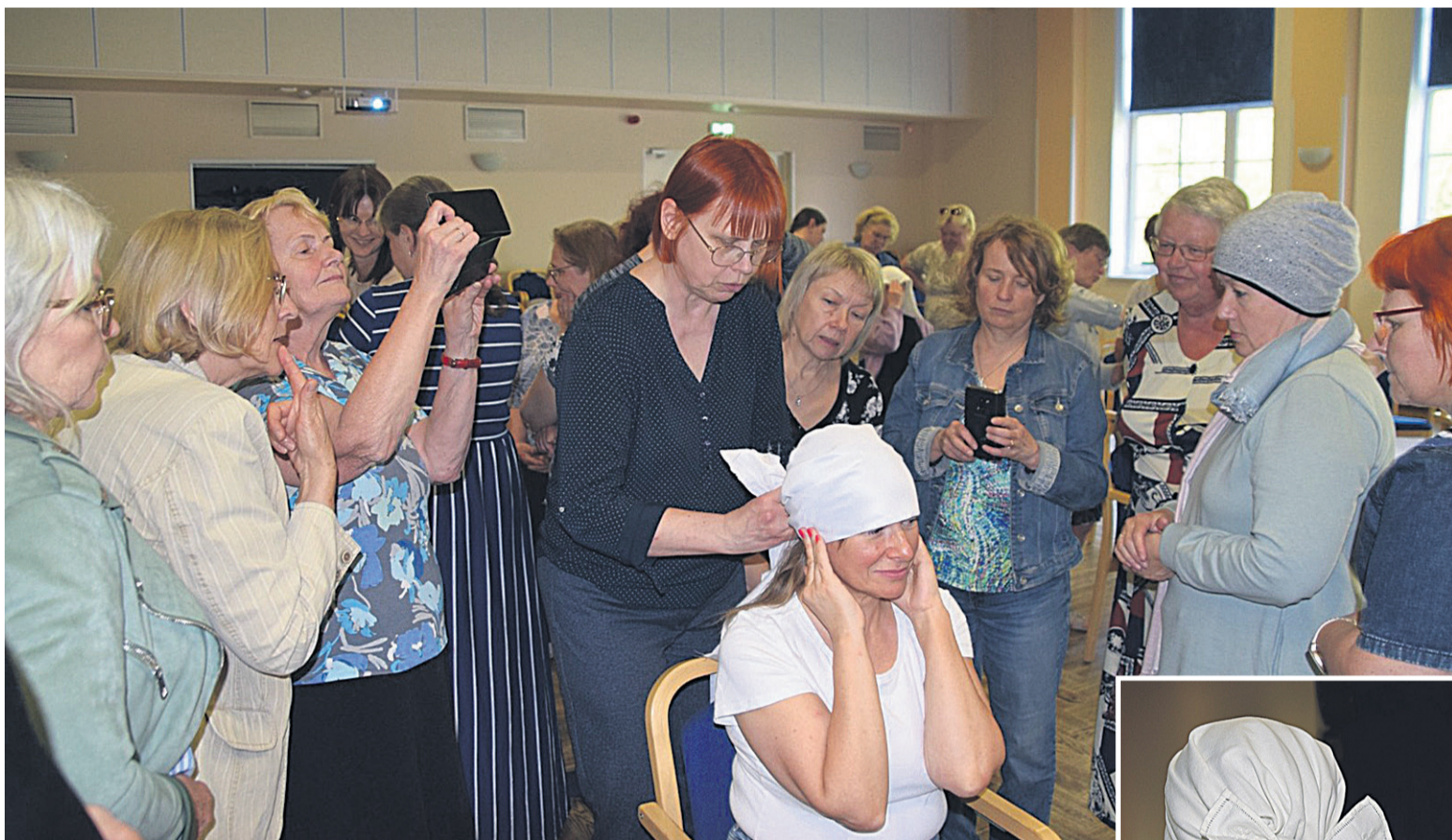
Pääräti tüükammer olli Karksi-Nuia kokku meeliten ulka naise üle Mulgimaa.