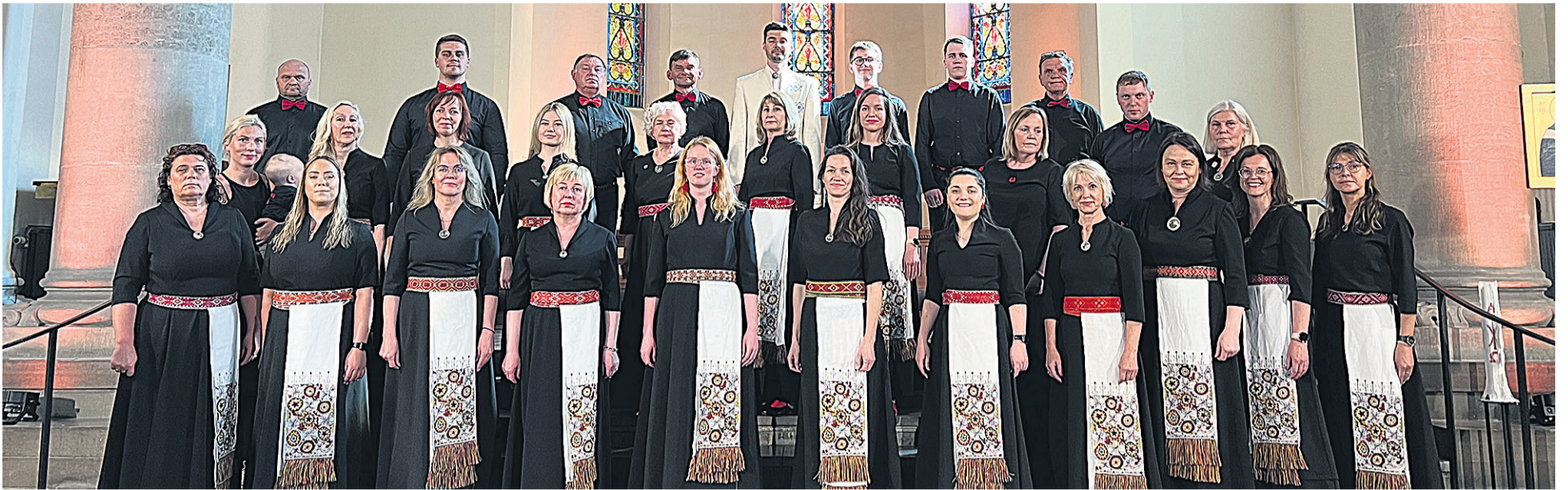
Mulgi segäkuur pääle suurt konserti Göteborgin Annedali kirikun.