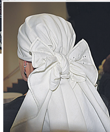
Õigeste seot päärätt om egä Mulgi naise uhkuseasi.