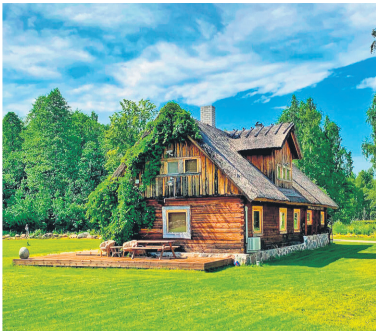
Romantiline Öökulli Kalamaja oodap külälisi Kalbuse külän Võrtsjärve veeren.

Kohe kindlaste ei ole sii ariulik puhkamise talu, kos tullas pallalt pidu pidäme – kik elu käip siin järve ja kala ümmer. Uviline saap ütän kogenu kala-