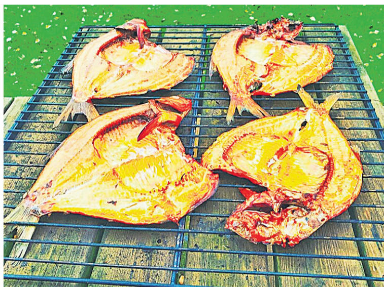
Kalamajan mõistetes egäst kalast väärt ruug valmis tetä.

alva ilma kõrral lämnen taren oma pundige istu, pidu pidäde või nõndasama aiga viita. Tarre üümajale mahup kuni 14 inimest, a suvitsel aal võip usseaia pääle telke kah panna.