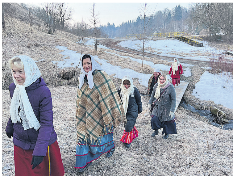
Pääle päevätõusu astsive kik naise anerivin Karksi Põrgualliku poole.

veere punatse paglage üle. Punast lõnga seoti kah endele kere, käte, jalgu ja pää ümmer, sest sii tõi õnne ja avit esiki valu vastu. Pannkoogi pidive maarjapäeväl suure oleme selleperäst, et sis kasvave suvel suure kapsta. Vanarahvas tääd, et ku maarjapäeväl lõngu kerites, sis kasvave suure ja kõva kapstapää. A kedrate es või, sest sis tekkuve suvel uisa kapuste pääle. Nõkla ja sõkla es või kah sel päeväl kät-