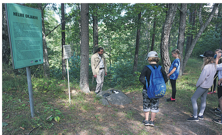
Elme Orjakivi lohu elksive nigu suure kurva silmä.