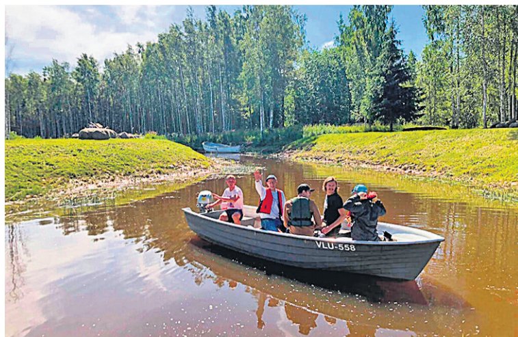
Paadisõidule ja kalale viias nii noore ku vana.

Kedä tõeste vii pääle ja kala manu ei kisu, nii võive siin nõndasama mõtsa müüda ulku, marju-siini korjate ja linde-luume ääli kullele. Talvitsel aal tetäs kah mootursaanisõite. Muduki saap sannan kävvä, tünnin vii sihen mõnulde, järven ojude ja