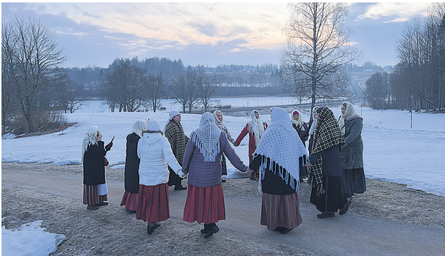
Mõni minut pääle kuut seisive naise sõörin ja meelitve mulgikiilse lauluge päevä vällä.