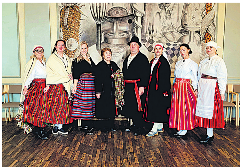
Mulgi valla kultuuritüü tegije Abja kultuurimajan.