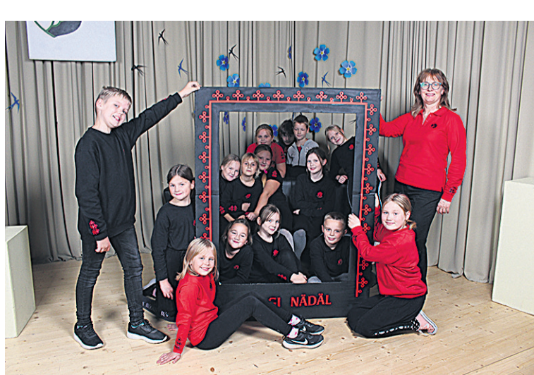
Abja koolin olli Mulgi nädälis uhke pildiraam tettu.