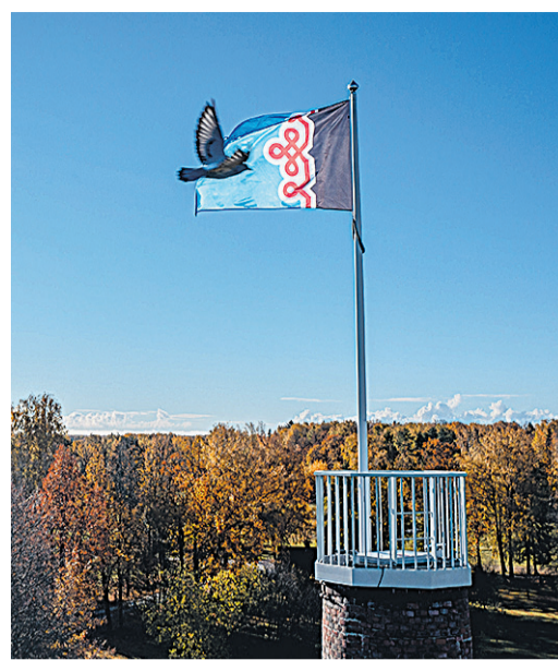
Mulgi Majaka otsan lehvip nüid Mulgimaa lipp.