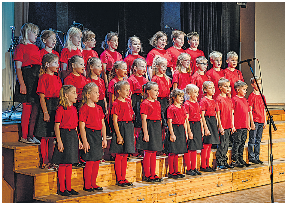
Tarvastu gümnaasiumi laululastel oli ette kanda mitu lustilist lastelaulu.