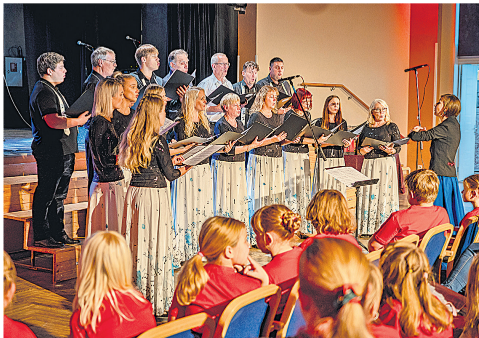
Mõisakülä kammerkuur Kungla sai lauluge "Siikõrd tule keväd tõisiti" publiku lemmikus.