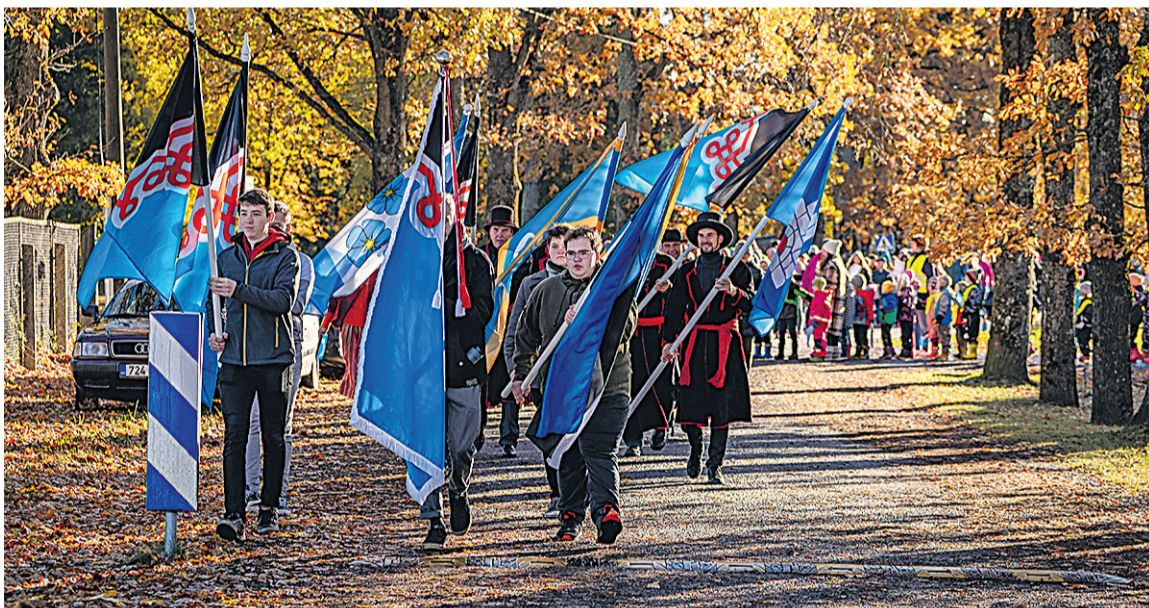
Mulgimaa lipu päev akas Mustlan pääle koolipere rongikäiguge Mulgi Majaka manu.