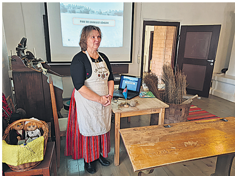
Laanemetsa Ly ERMi Eimitali muuseumin linajuttu aaman.