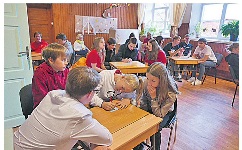
Mälumängul saive kokku kuvve Mulgimaa kooli õpilase.