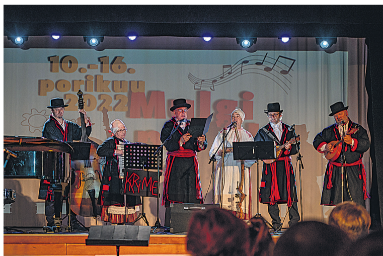
Tõrva rahvamuusikaansambel Kirime tõi püüne pääle neli laulu.