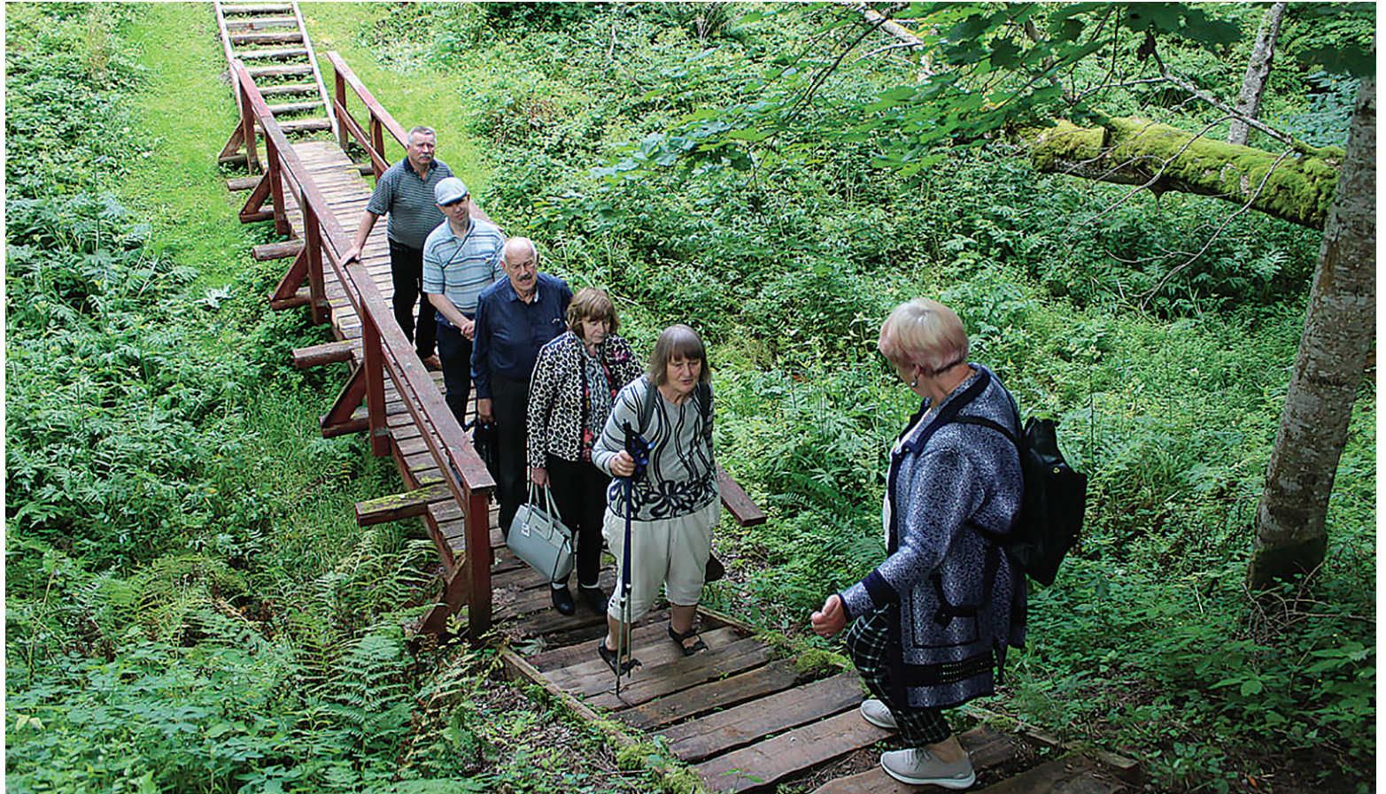
Reisilise tiil Kuurküla koobaste manu.

Loodame, et riik toetep kah järest rohkemb viirmisi kante. Usume, et riigi ja valdu valitseje mõistave tetä tarku otsussit, et alla jääs mede ilus luudus ja rikas kultuur. Villändi linnale ja maakonnale tahame olla ää abimihe,