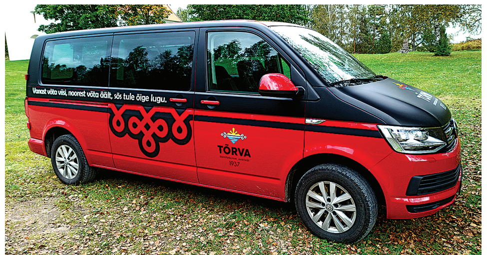
Sii tore mulgimustreline ja mulgikiilse kirjage bussike sõidap Tõrvan joba 2019. aastest saadik.