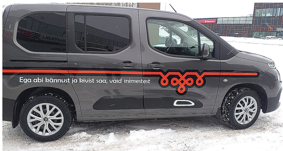
Siandse kaaruspaglamustre ja tarkusetäre saive pääle kik kolm uut Tõrva valla autut.