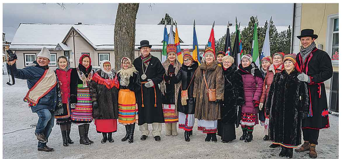
Apja olli kokku tullu ulka kiriveste rahvarõövastege õimlasi. Esieränis rõõmsas tei neid õimurahvaste lipurivi, sest pallude jaos neist ei ole oma lipu nägemine egäpäeväne asi.