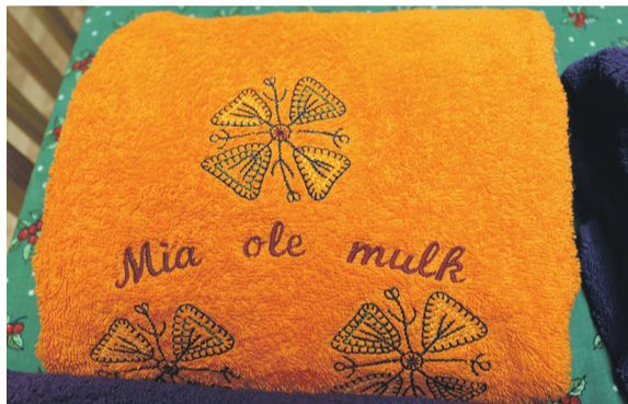
Lõuna-Mulgimaa Puuetege Inimeste Ühing sai toetust Mulgi mustride ja rahvarõovaste tüükambride jaoks Abja Päevakeskusest. Osa asju om joba valmis kah saanu.

“Olli ulka egäaastesi projekte, nagu Mulgi Kultuuri Instituudi tüütoetus, Väikse Virre, ERR-i mulgikiilse raadju-uudis jt. Ja olli kah peris uusi. Üits uus