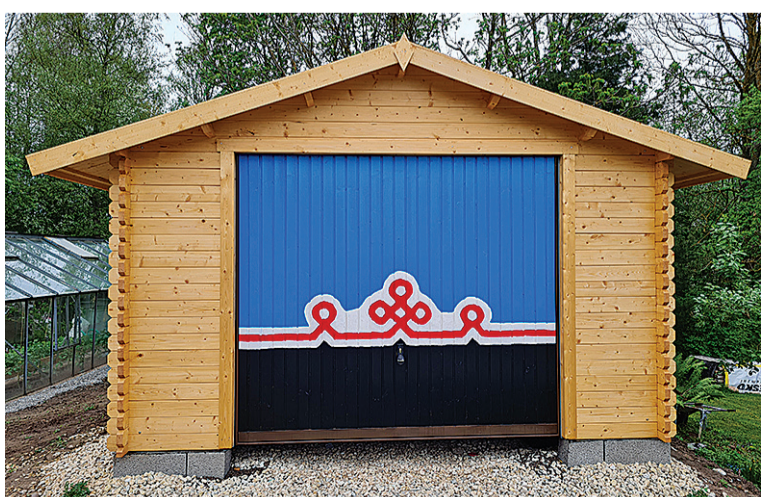
Mulgimaa lipuge kuuriuss Villändi vallan Soe külän.

reis Mulgimaale ja et põnevemb oles, kõrralde kah ütökõrrage päeväpildijaht mulgi mustride pääle. Seni korjat pildi om kik üleven mulgimaa.ee lehe pääl vebialbumiden. Üvve pildi pandas samamuudu sinna kigile vaatemes üles. Pilte oodetes ütän allkirja ja auturi nimege e-aadressi pääle kristi@mulgimaa.ee. Ää meelege võetes viil vastu kah postkastipilte ja muid pilte, kos mõni tore mulgimustreline asi pääl.