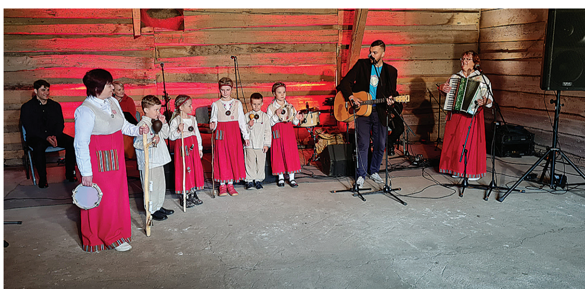
Tantsu ja lauluge rõõmustive pidulisi Tarvastu lasteaia latse ja nende õpeteje.